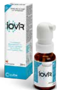
ΠΡΟΣΤΑΣΙΑ & ΑΝΤΙΜΕΤΩΠΙΣΗ Spray για το λαιμό