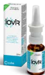
ΠΡΟΣΤΑΣΙΑ & ΑΝΤΙΜΕΤΩΠΙΣΗ Spray για τη μύτη