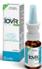
ΑΝΤΙΜΕΤΩΠΙΣΗ & ΑΠΟΣΥΜΦΟΡΗΣΗ Spray για τη μύτη