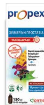
ΣΙΡΟΠΙ ΓΙΑ ΟΛΗ ΤΗΝ ΟΙΚΟΓΕΝΕΙΑ

Ο Σαμπούκος (Elderberry) υποστηρίζει το ανοσοποιητικό σύστημα, μαλακώνει και καταπραΰνει τον λαιμό.